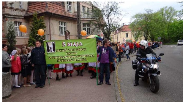
Dzień Godności Osób Niepełnosprawnych Intelakualnie / Gryfino