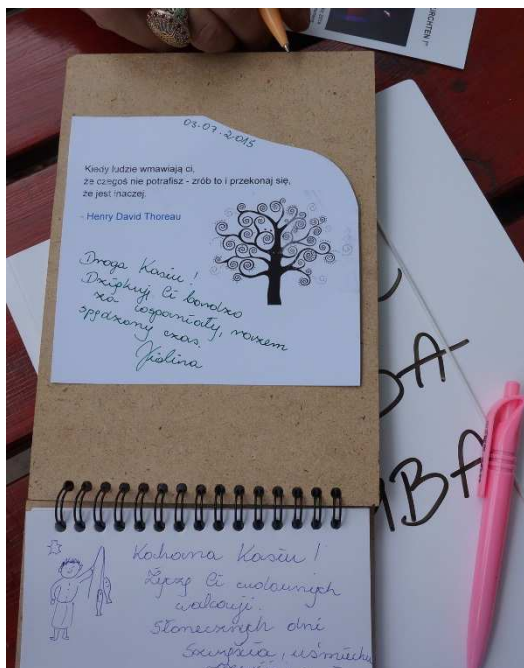
Fot. Pamiątki i niespodzianki na zakończenie wspólnej pracy dla aktorów teatru.