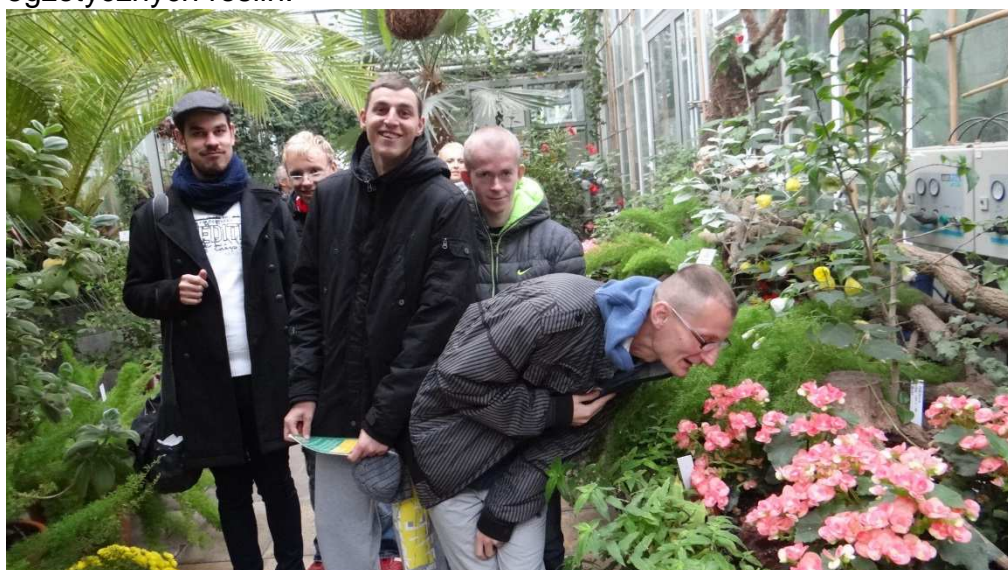
Fot. Wizyta w ogrodzie dendrologicznym w Potsdamie.

Wyjazd na wycieczkę do Potsdamu. Spotkanie z Teatrem Barenherz. Wizyta w parku dendrologicznym – Ogrodzie Sasouci. Udział w warsztatach z robienia czekolady. Spacer z przewodnikiem po ogrodzie. Poznawanie gatunków i rodzajów egzotycznych roślin.