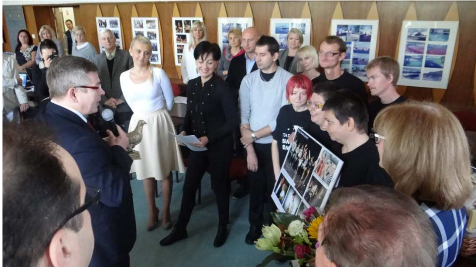
Fot. Teatr Bomba Bomba obecny na sesji Rady Miasta Gryfina