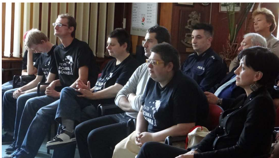
Fot. Teatr Bomba Bomba obecny na sesji Rady Miasta.

Teatr osób niepełnosprawnych został doceniony i zauważony przez władze miasta. Na uroczystej sesji odczytano wszystkie osiągnięcia teatru. Aktorom i osobom wspierającym funkcjonowanie teatru wręczono pamiątkowe dyplomy i upominki.