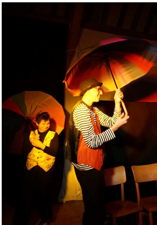
Fot. Spotkanie w Greiffenbergu.