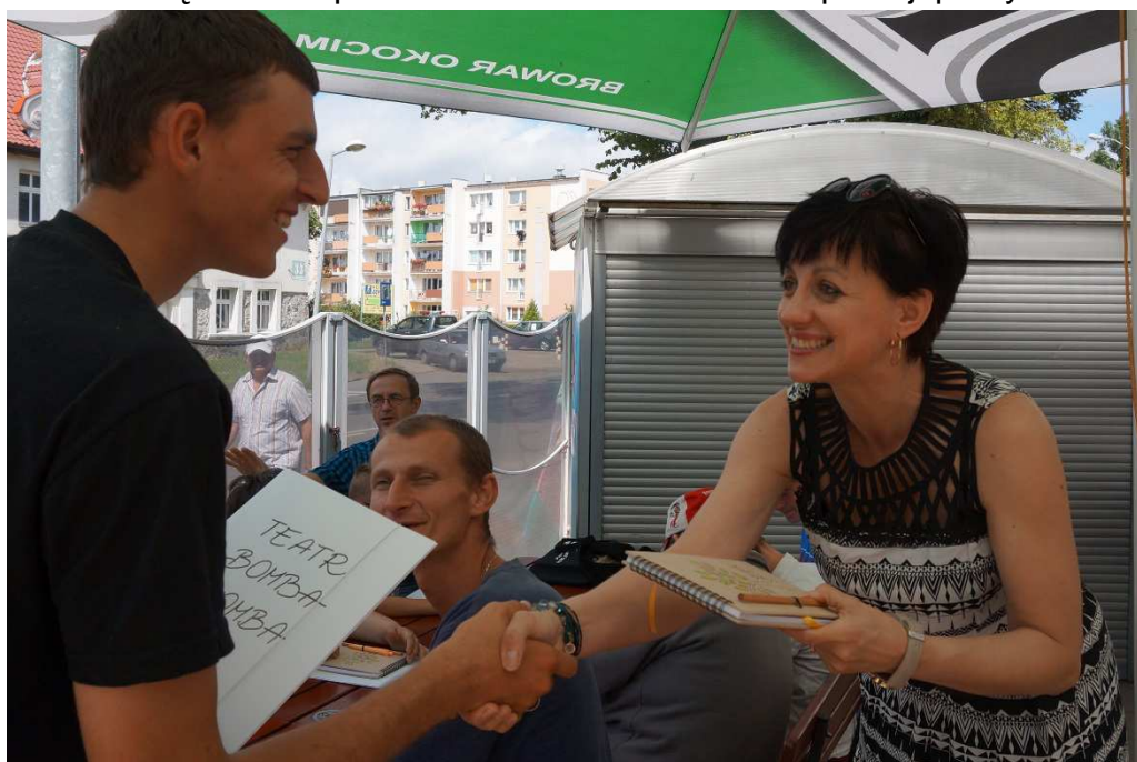
Fot. Wręczenie pamiątek dla aktorów teatru.