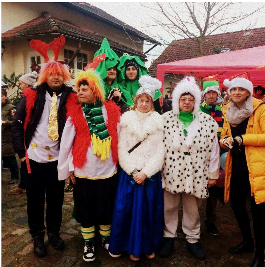
Fot. Jarmark Bożonarodzeniowy Mescherin