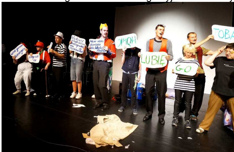
Fot. Próba generalna spektaklu „ Można się lubić”

Próba wyjazdowa w Schwedt. Spotkanie warsztatowe z Teatrem Barenherz. Próba spektaklu na scenie teatru Uckermarkische Buhnen. Nagrania do filmu dokumentalnego. Ćwiczenia integracyjne i relaksacyjne z teatrem niemieckim.