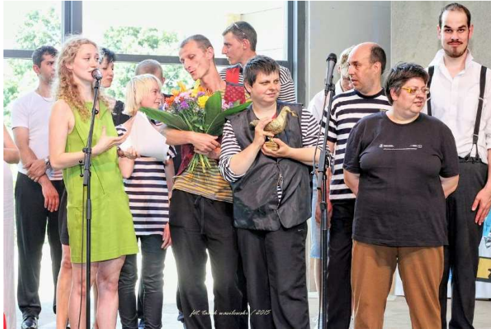
fot. Przekazanie Złotego Gołębia