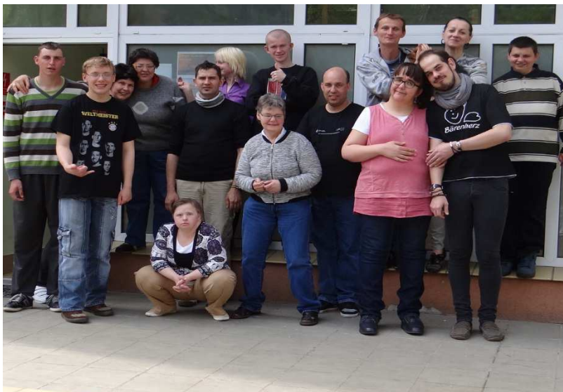
Teatry Bomba Bomba/ Gryfino i Barenherz/ Schwedt Niemcy

Spotkanie z niemieckim zespołem Barenherz. Udział we wspólnych warsztatach teatralnych. Ćwiczenia integracyjne, relaksujące. Poszukiwanie wspólnych pomysłów na spektakl. Praca w jednym zespole. Tworzenie elementów scenografii do nowego spektaklu.