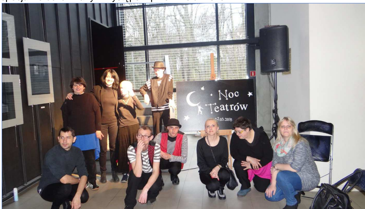
Kołobrzeg „ Noc teatrów”

- Wyjazd zespołu na prezentacje do Kołobrzegu był dużym wydarzeniem zarówno turystycznym, jak i artystycznym. Festiwal nie był skoncentrowany na występach osób niepełnosprawnych. Miał otwartą formułę, co ma ogromne znaczenie w artystycznych prezentacjach Teatru Bomba Bomba i wchodzeniu grupy w społeczeństwo. Występ zespołu został przyjęty entuzjastycznie, a także był specjalnie oczekiwanym występem przez wielu widzów.