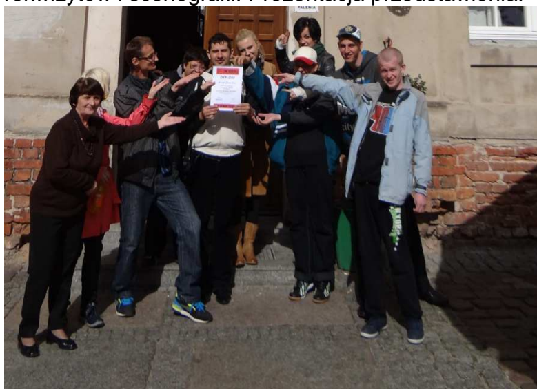
Świdwin, Przegląd ARA

Udział w festiwalu – Przegląd Amatorskich Zespołów Teatralnych w Świdwinie. Udział w prezentowanych spektaklach, przygotowanie do własnej prezentacji. Próba przed spektaklem. Rozgrzewka ciała, i głosu, Organizacja przestrzeni scenicznej, rekwizytów i scenografii. Prezentacja przedstawienia.