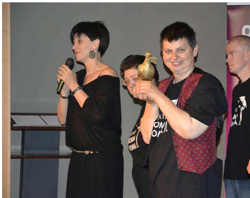
Fot. Teatr Bomba Bomba na Kongresie Kobiet w Gryfinie