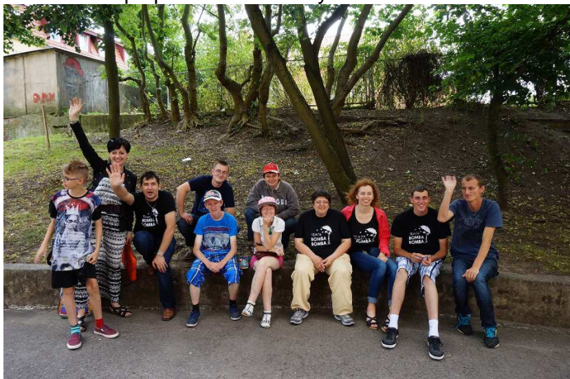
Fot. Teatr Bomba Bomba i przyjaciele, na uroczystym zakończeniu.

Regularne spotkania i realizacja spektaklu z zespołem niemieckim były wyjątkowymi doświadczeniami dla obydwóch grup. Taka polsko niemiecka współpraca ma ogromne znaczenie dla indywidualnych osób, biorących w nich udział, ale także ogromne znaczenie w aspekcie społecznym. Ponad granicami osoby niepełnosprawne intelektualnie udowodniły, że mogą się ze sobą nie tylko spotykać, ale także współpracować i tworzyć.