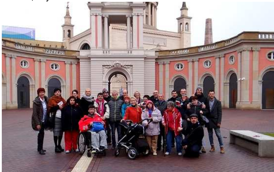
Fot. Spotkanie w Parlamencie w Potsdamie