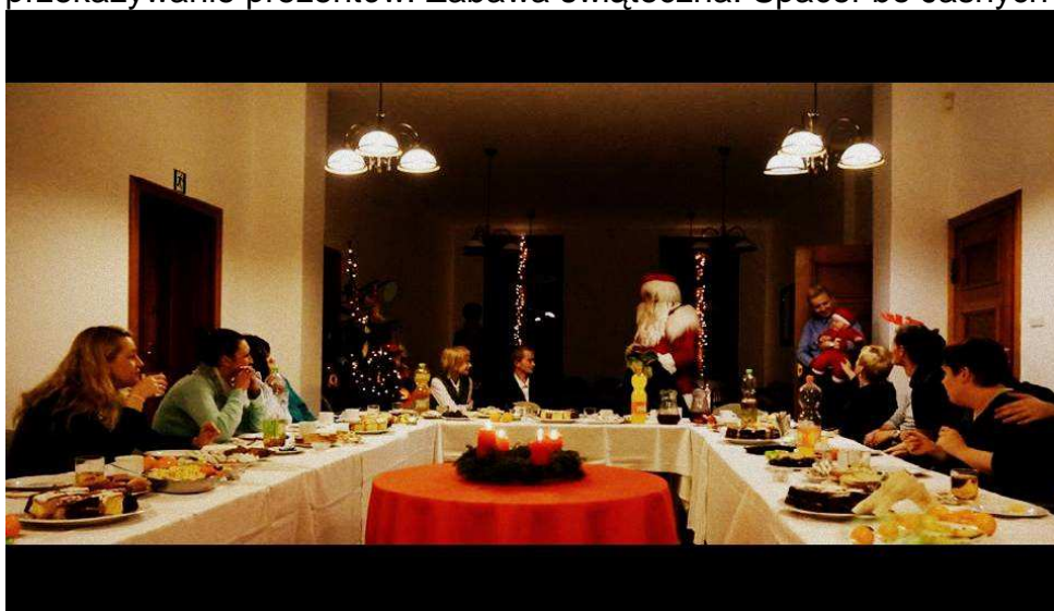
Fot. Wigilia Bomba Bomba i Barenherz.

Spotkanie wigilijne, wyjazdowe w Villi Bonhoeffera w Szczecinie. Przygotowanie do uroczystej wigilii, przygotowanie prezentów, stołów i świątecznego wystroju. Wspólne z gośćmi strojenie choinki. Przygotowanie dekoracji na choinkę. Udział w uroczystej biesiadzie wigilijnej. Wspólne z gośćmi kolędowanie. Składanie sobie życzeń, przekazywanie prezentów. Zabawa świąteczna. Spacer bo Jasnych Błoniach.