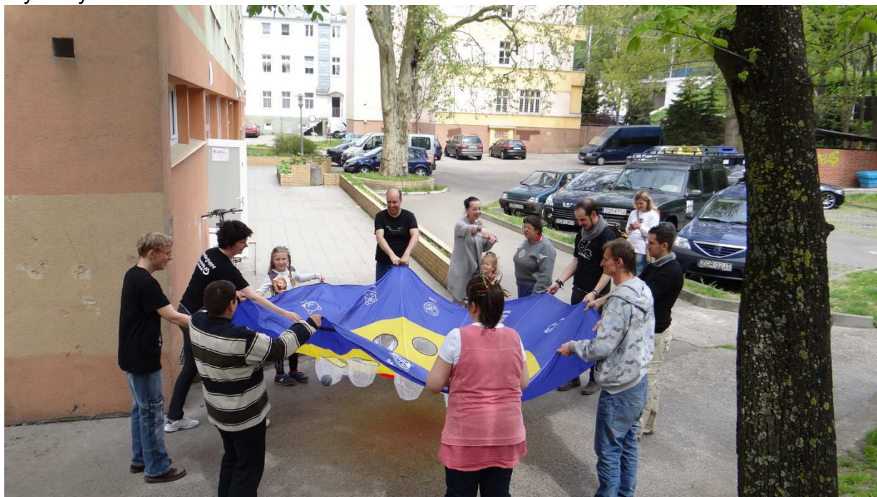
Teatry Barenherz i Bomba Bomba, CAL Gryfino

Spotkanie z teatrem niemieckim Barenherz. Wspólne ćwiczenia integracyjne i rozgrzewkowe. Zabawy w grupie rozwijające uważność na drugą osobę. Ćwiczenia na świeżym powietrzu z elementami relaksacji. Praca nad spektaklem. Opracowywanie scenek, improwizacje z przedmiotem i cieniem. Puszczanie baniek mydlanych na nabrzeżu. Ćwiczenia oddechowe.